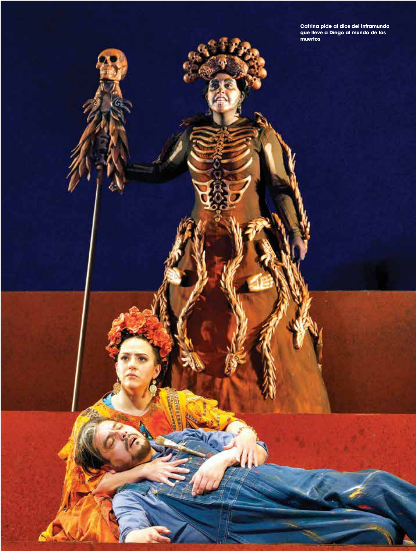
Catrina pide al dios del inframundo que lleve a Diego al mundo de los muertos